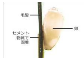
髪の毛に固着するシラミの卵

アタマジラミの卵は、セメントのような硬い物質でしっかりと髪の毛に固着しているため、シラミを駆除した後も卵や卵のぬけがらは残ってしまいます。目の細かい「専用くし」なら、気になる卵や卵のぬけがらをスッキリ取り除くことができます。