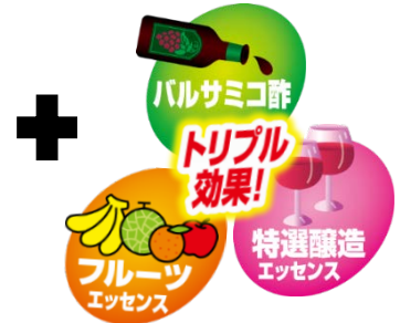
従来のこだわり誘引処方

テンナンショウとは… コバエなどの昆虫に花粉を運ばせ 受粉している植物。 コバエを「香り」で誘引しています。 ↓ 香り成分のうち、 高い誘引効果がある成分をプラス!