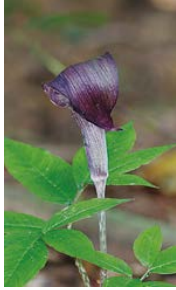
テンナンショウの香り成分

テンナンショウとは… コバエなどの昆虫に花粉を運ばせ 受粉している植物。 コバエを「香り」で誘引しています。 ↓ 香り成分のうち、 高い誘引効果がある成分をプラス!